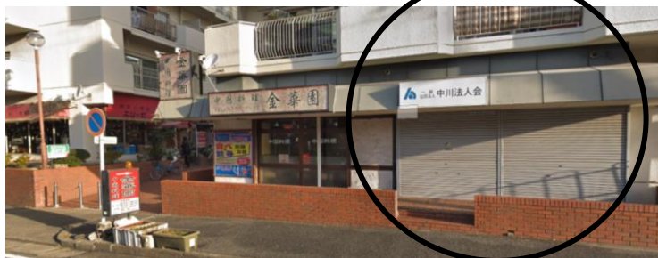
〔(一社)中川法人会 中川区山王 2-6 一光ハイツ山王 B-102〕